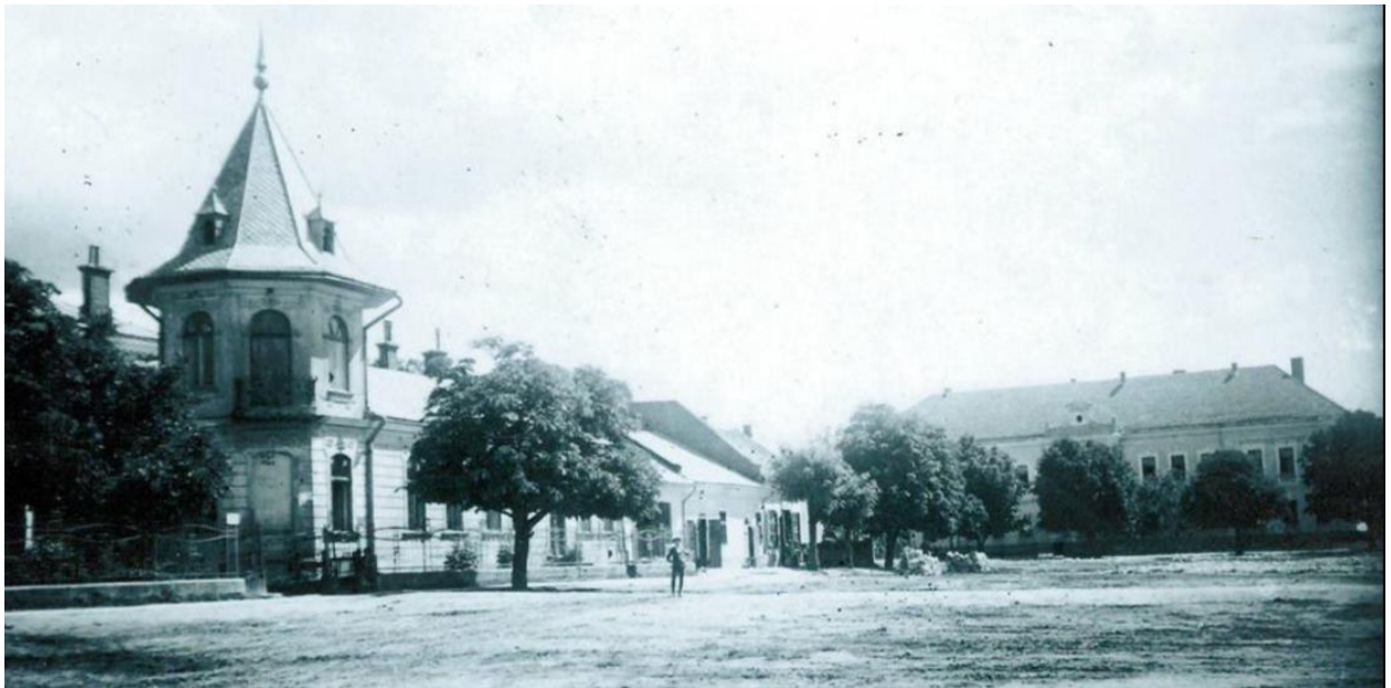
Площа ринок. Східний бік, 1930-ті роки 14

Серед перших поселенців у місті Миколаєві євреїв не було. Більше того, міщани добилися у тодішнього орендатора міста сокальського і самбірського старости Юрія Мнішка у 1595 р. в доповнення до локаційного магдебурзького привілею від 20 лютого 1570 р., конфірмованого королем Стефаном Баторієм у 1576 р., нового привілею, затвердженого королем Сигізмундом III у 1596 р. В цьому привілеї було записано «оскільки з вкоріненням і розродженням жидів по містах наших більша шкода ніж користь і більша нужда ніж збагачення походить, тоді на прохання тих же міщан наших дозволяємо і постановляємо, щоби жоден жид в місті нашому названому Миколаєві і на передмістях не бдувався, ні жодного помешкання не мав і купецтва жодного не привозив...».