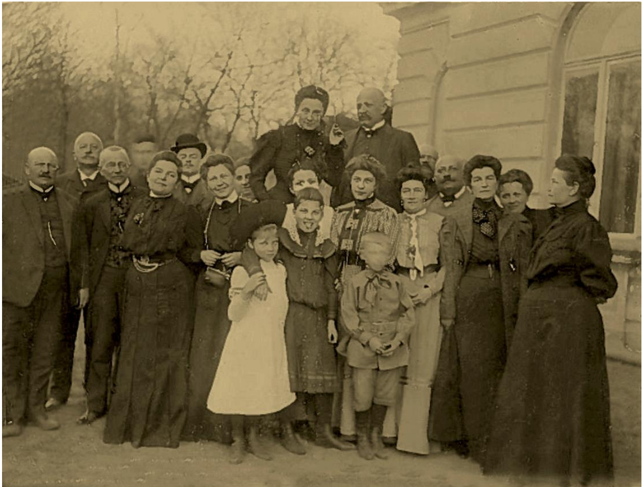
Сім'я Марса гербу Нога – останні власники Судової Вишні 52

власності на село Новоселиця у Теребовлянській волості 51 . У подальшому від від 1545 року тут почали відбуватися сесії шляхетського суду Перемиської землі, звідки виник прикметник «судова». Лише у 1741 році вперше у документах з'являється назва «Судова Вишня» (Sądowa Wisznia), щоб відрізнити її від інших подібних поселень: Бенькова Вишня біля Рудок, Годовишня біля Городка, Вишенька біля Крукеничів. Через це невірними є спроби пояснення походження назви міста від однойменної назви садового дерева чи тлумачення про те, що тут «судили і вішали» людей.