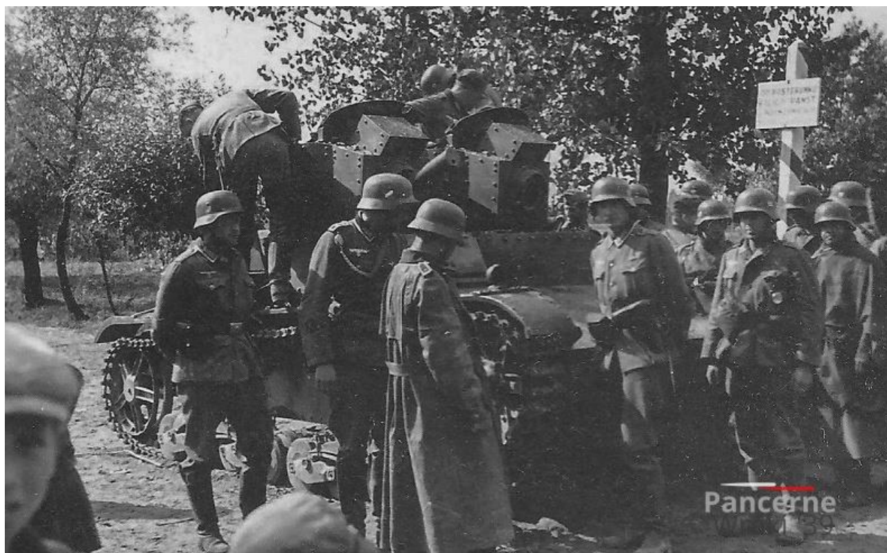
Німецькі війська на дорозі Радомно-Краківець, 1939 р. 7

У квітні 1943 року місцеве гетто було ліквідовано – під час акції було знищено понад 3,5 тис. осіб.