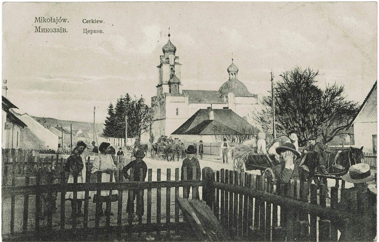
Mikołajów. Cerkiew. Миколаїв. Церков.