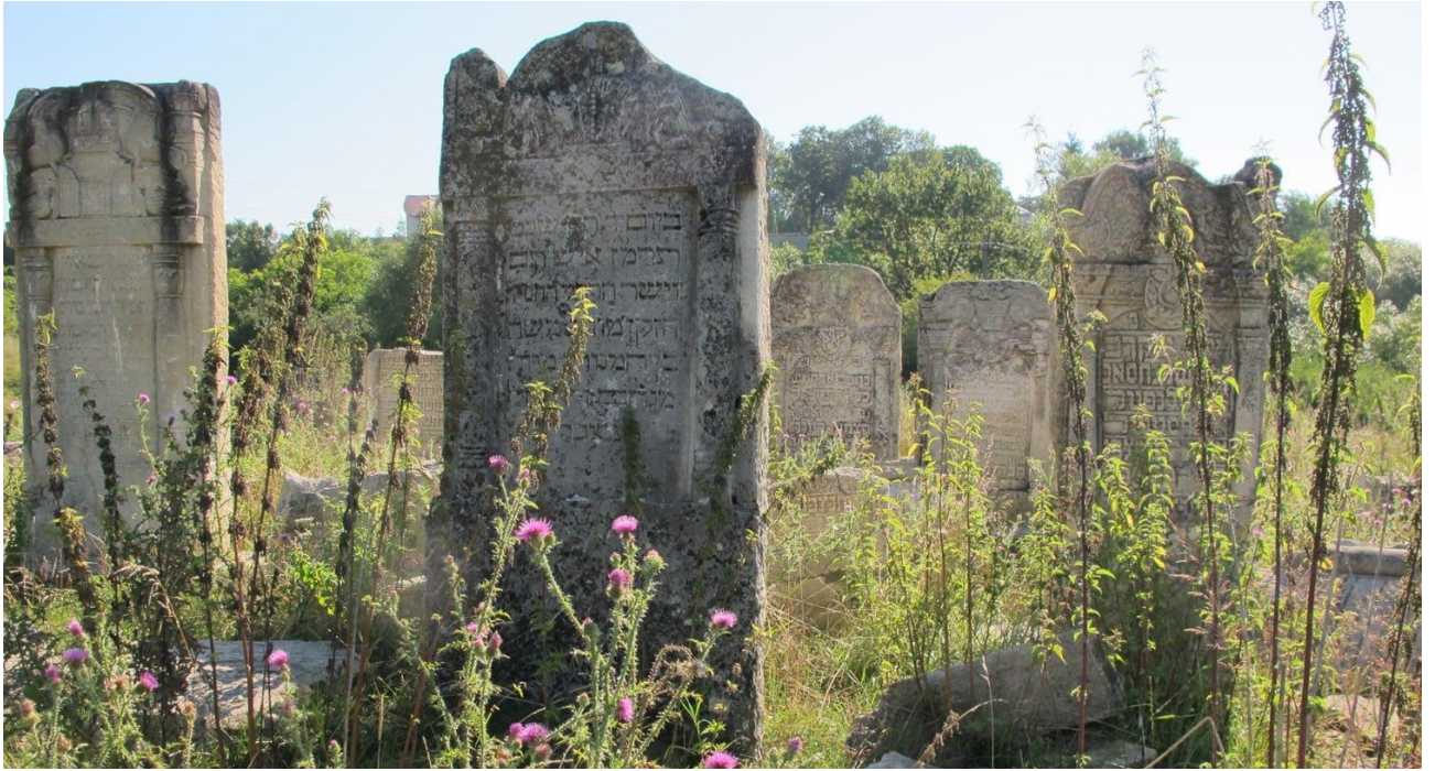
Розділ, єврейський цвинтар. 2017 р.