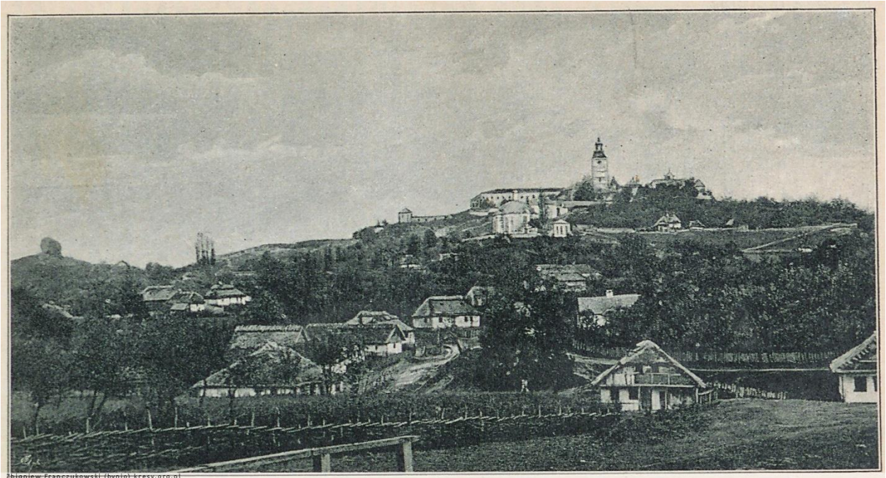
Підкамінь, 1892 р. 28

Під час I Світової війни Підкамінь часто руйнували (у 1916 та 1920 рр.) Багато мешканців, особливо євреїв, утекли до Австрії та Угорщини. А 1920 р. багато з них емігрувало до Пітсбурга (Пенсільванія, США) . Воєнне лихоліття не минуло безслідно, і по війні, у 1921 р., вже у міжвоєнній Польщі у Підкамені тільки 822 євреї. І тільки у 1939 р. їх знову близько 1000. В січні 1942 р. – 927 євреїв.