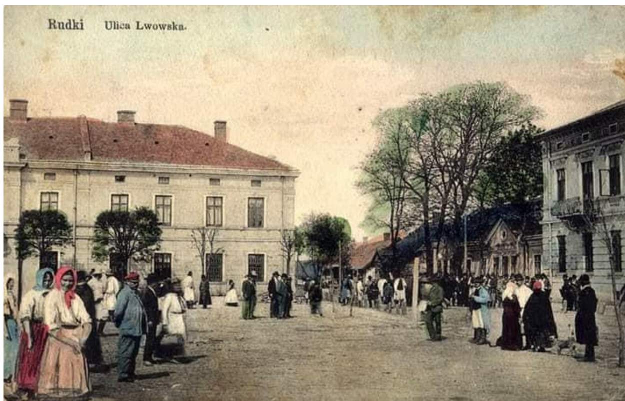
Рудки, вулиця Львівська (нині площа Відродження). 1914 р. 43

Містечко Рудки розташоване при автомобільному і залізничному шляхах зі Львова до Чопа. Найвірогідніше, що назва населеного пункту пішла від червонуватої глини, яку називали «рудава» або «руда». До категорії міст було віднесено в 1939 р.