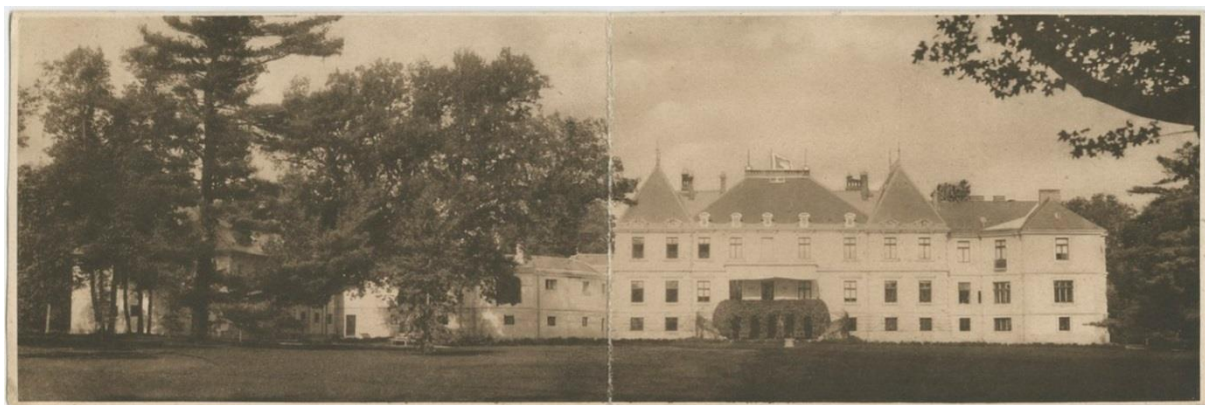
Розділ, палац Жевуських-Лянцкоронських. 1925 р. 37

З 12 червня 2020 р. після об'єднання міських та селищних рад області, входить до складу Новороздільської ОТГ.