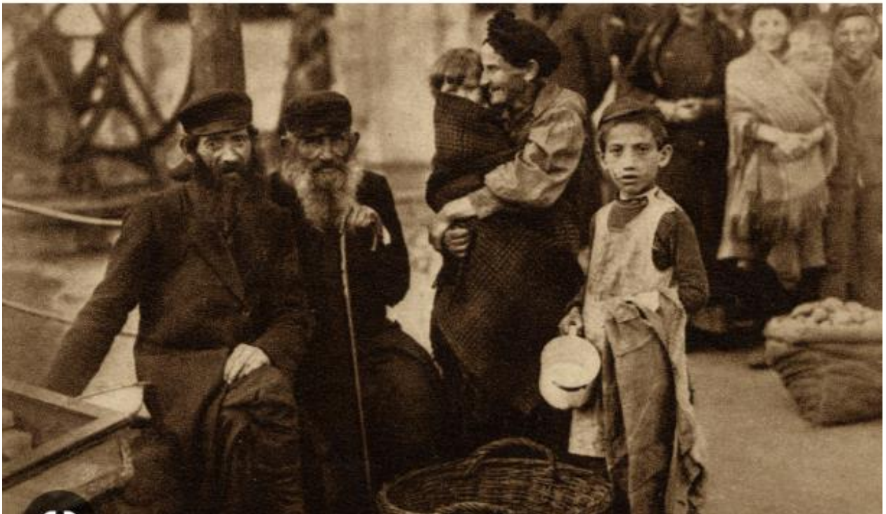
Євреї Краківця перед Другою світовою війною

Довгий час Краковець (українська назва) дрімав як хутір, що прилягав до кордону України з Польщею. Але минулого року він потрапив у новини внаслідок вторгнення Росії в Україну, ставши головним транзитним пунктом для потоків українців, які тікають на захід. Це «містечко, про яке ви навіть не чули», знову опиняється у вирі історії».