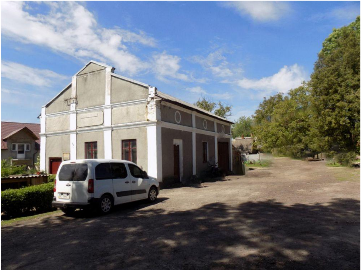
Колишня синагога у Підкамені (сучасний вигляд будівлі), 2020 р. 27

Окописько було закладене на захід від міста, за міськими укріпленнями. Муровані синагога і школа показані на кадастральній карті Підкаменя за 1844 рік 26 .