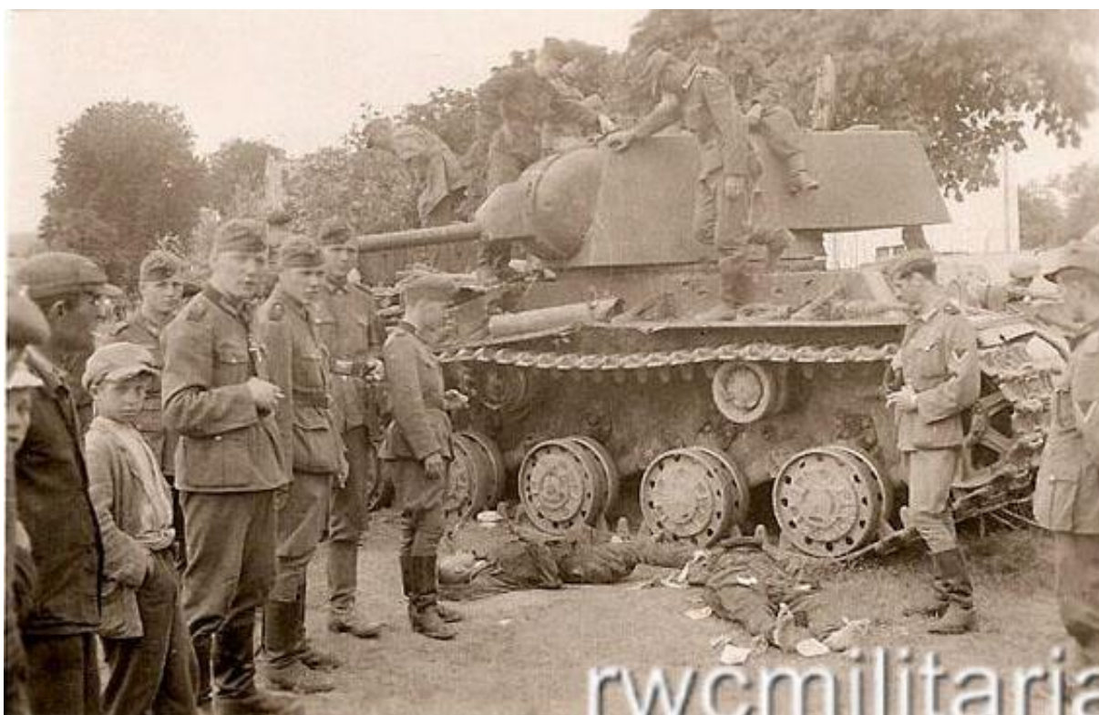
Німецькі військові у Миколаєві, 1 липня 1941 р. 15

1 липня 1941 року німецькі війська увійшли до Миколаєва. У серпні 1941 року в місті була створена німецька цивільна адміністрація; Миколаїв увійшов до Стрийського повіту дистрикту Галичина. У місті діяла німецька військова поліція та відділ української допоміжної поліції.