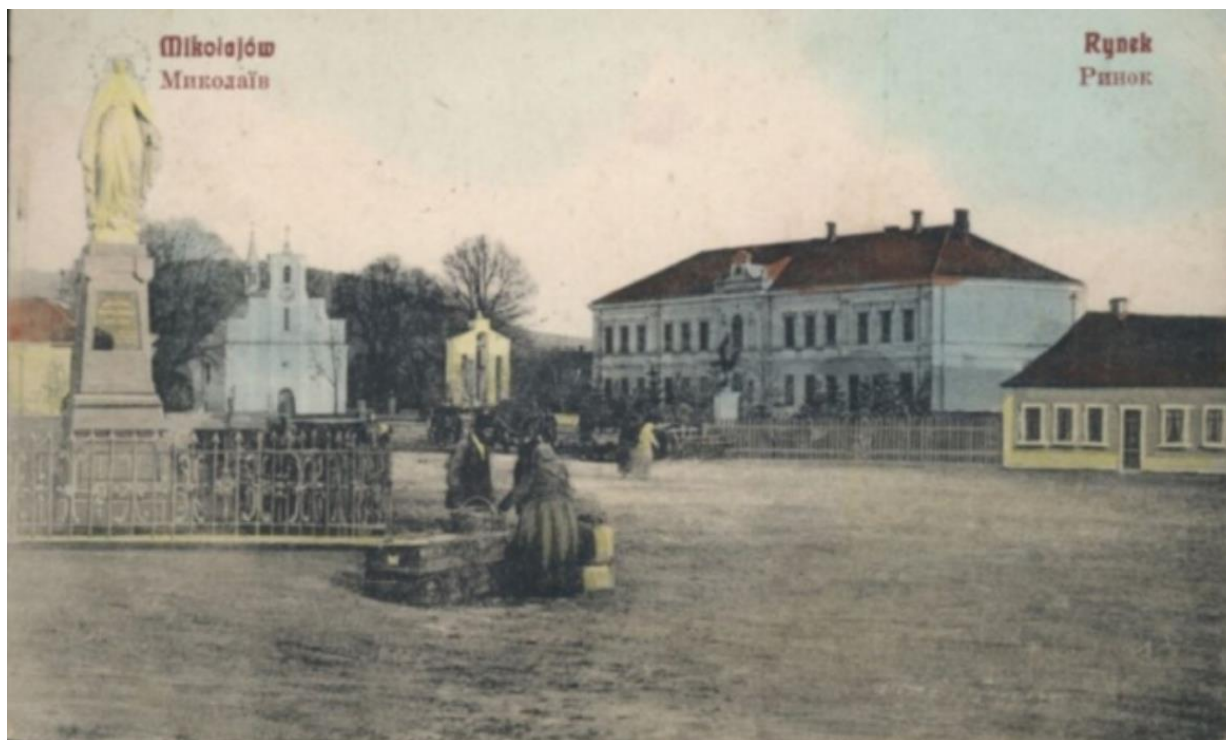
Миколаїв, площа ринок. 1912 р. 10

Місто Миколаїв розташоване неподалік від річки Дністер, за 3 км від залізничної станції Миколаїв-Дністровський. Воно є районним центром Львівської області.