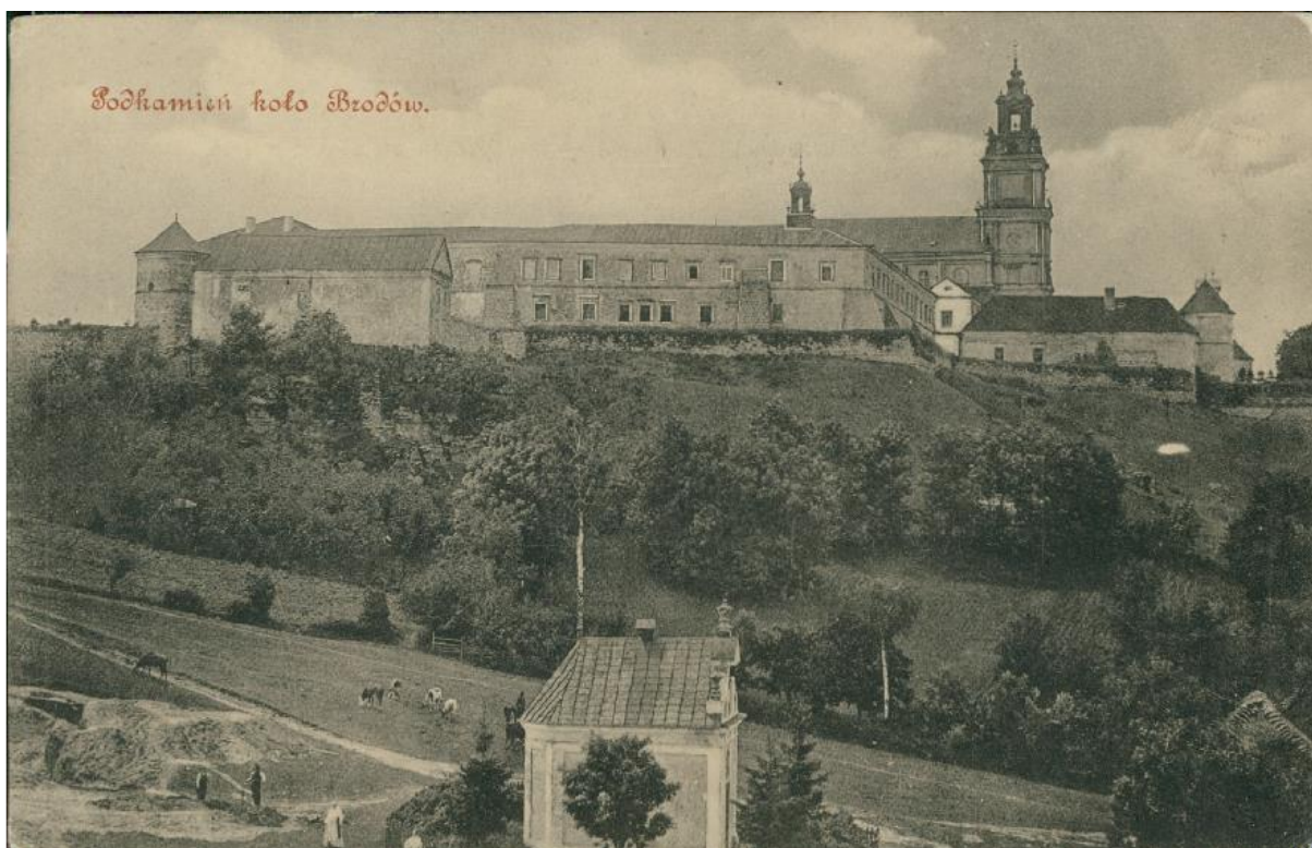
Підкамінь, 1915 рік 18

Підкамінь колись місто, а тепер селище міського типу, Бродівського району Львівської області. Підкамінь розташований на стику Волинських височин та Подільських Товтр на вододілі між басейнами Дніпра і Дністра. Завдяки вдалому географічному розташуванню, сприятливому для проживання людей клімату і багатому на воду, родючі ґрунти, і тваринний світ ландшафту, територія сучасного Підкаменя приваблювала до себе людність, починаючи із стародавніх часів. Давнє поселення розташовувалося біля підніжжя знаменитого 16-ти метрового кам'яного останця, прозваного в народі «Каменем».