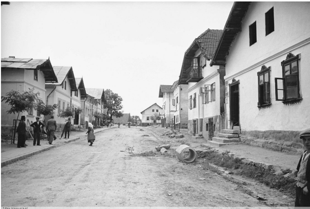
Розділ, 1938 р. 36

Поле «Розділ», що належало королівським селам Крупське та Березина, згадане в королівській грамоті Владислава II від 5 червня 1462. Саме слово «розділ» слід ототожнювати з поняттям «межа». Роздільне поле було межовим між двома селами, розділювало їх.