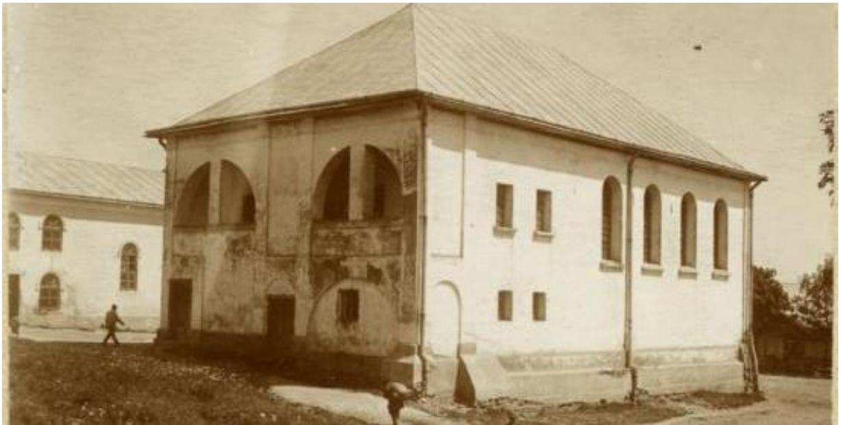
Синагога в Краківці, ХІХ століття. 4

Станом, на 1 січня 1939 року у місті мешкало 1840 осіб (640 українців-грекокатоликів, 80 українців-римокатоликів, 350 поляків та 770 юдеїв).