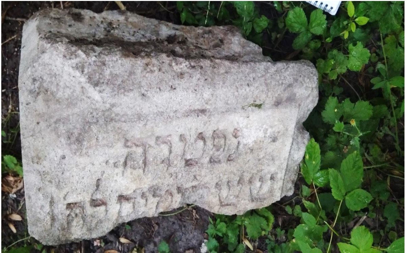
Рештки мацеви на єврейському цвинтарі 32