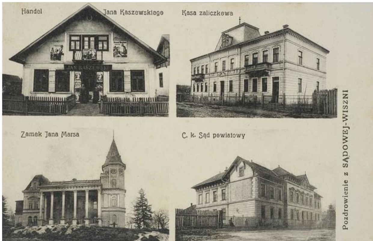
Судова Вишня на початку ХХ століття 48

Першу письмову згадку про Вишню (так місто називалося до 1545 року) знаходимо у Галицько-Волинському літописі у 1230 році. 49 У ній повідомляється про пересторогу тисяцького Дем'яна князеві Данилові Романовичу про змову проти нього місцевих бояр та плани убити його в місцевому замку.