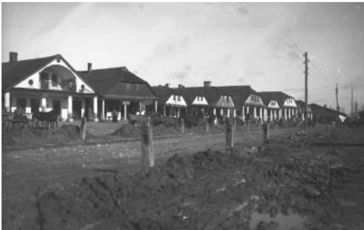
Підкамінь, ринкові будинки з підсінням, 1915 р. 21

1866 року Казимир Мікульський відзначив, що «містечко Підкамінь мале, неохайне, більшою мірою, заселене юдеями, піддалося б цілковитому забуттю, якби над ним на горі не підносилися на декілька миль видимі мури святині».