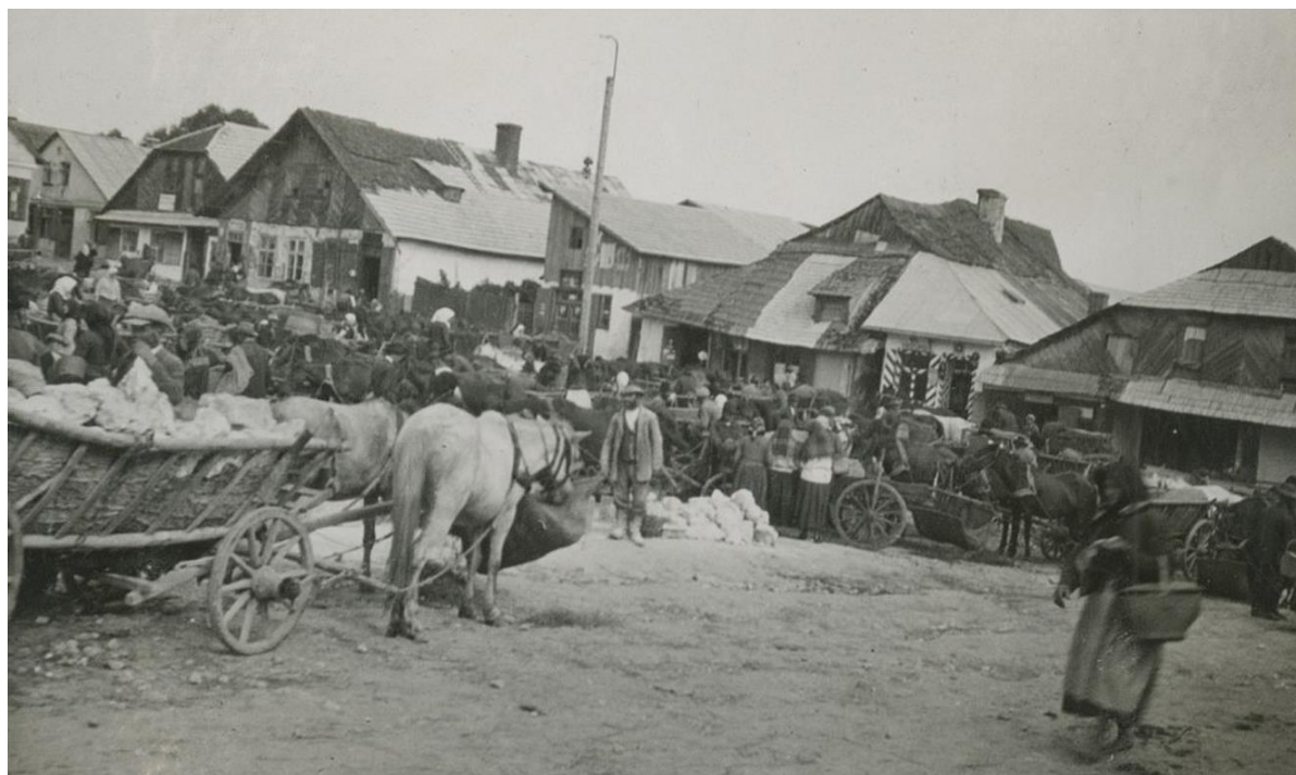
Торговиця в Роздолі, 1930 р. 38