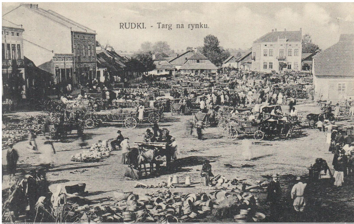
Рудки, торгівля на ринку, 1910-1914. 44

усипальниця родини Фредро. Зокрема, у ній похований Олександр Фредро (1793–1876), відомий польський комедіограф, дід Митрополита Української Греко-Католицької Церкви – Андрія Шептицького, а також інші члени його родини. У дзвіниці костелу в 2016 р. з нагоди 140-ої річниці від дня смерті драматурга відкрито музей Олександра Фредро.