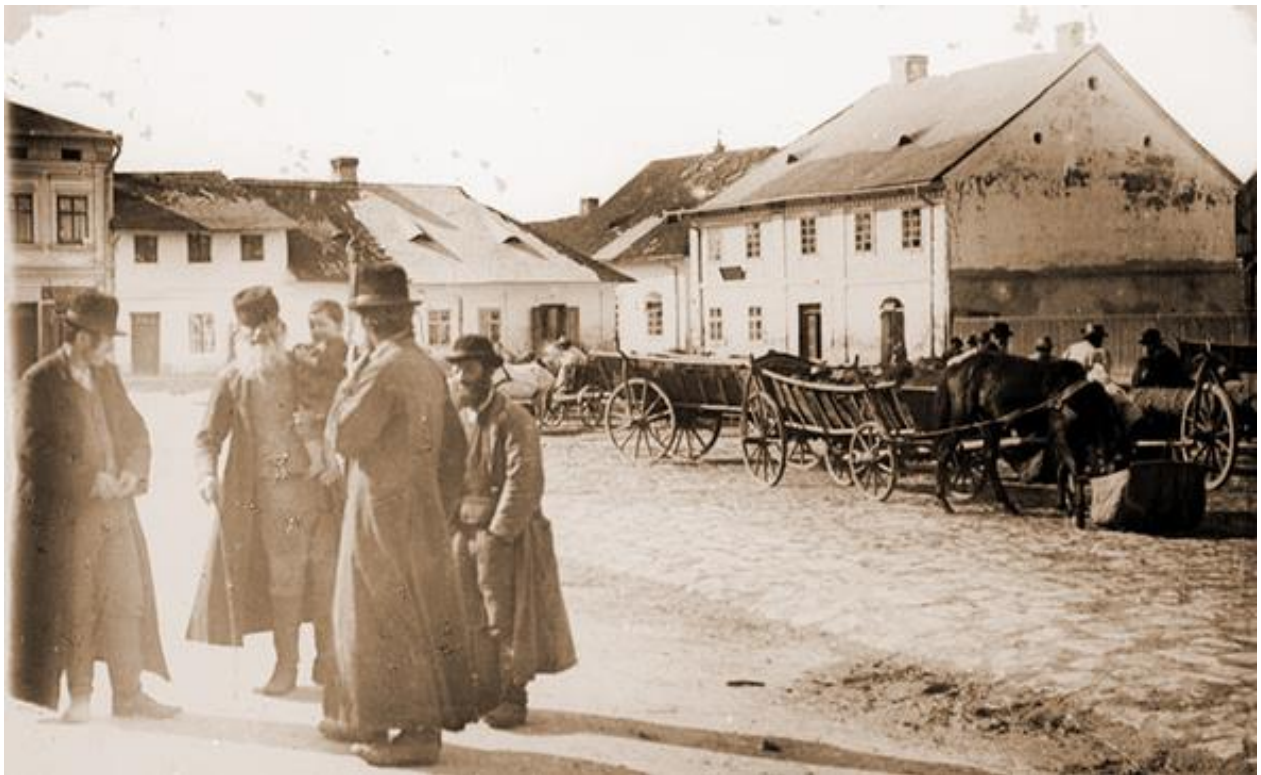
Євреї у Судовій Вишні, 1932 р. 58

Основну статтю доходів єврейського кагалу у Судовій Вишні складала прибутки з ритуального забою худоби (для приготування кошерного м'яса). 20 березня 1933 року мостиський староста Міхал Сенкевіч направив лист у воєводське управління щодо бюджету єврейської гміни Судової Вишні за 1932 р., а також новозатверджений проект бюджету на 1933 р. та скарги рабина Лейби Бабада. Прибутки єврейської громади у 1933 році становили 17 802 злотих. Основною статтею надходжень був ритуальний забій тварин, що приносив у рік 14 311 злотих. З забою худоби різного гатунку надходило 10 876 злотих (у 1932 році — 10 923), з дробу різного гатунку — 3 434 зл. Друга стаття доходів — лазня, з якої поступало 1880 злотих. Загалом видатки кагалу у 1933 році становили 17 735 злотих.