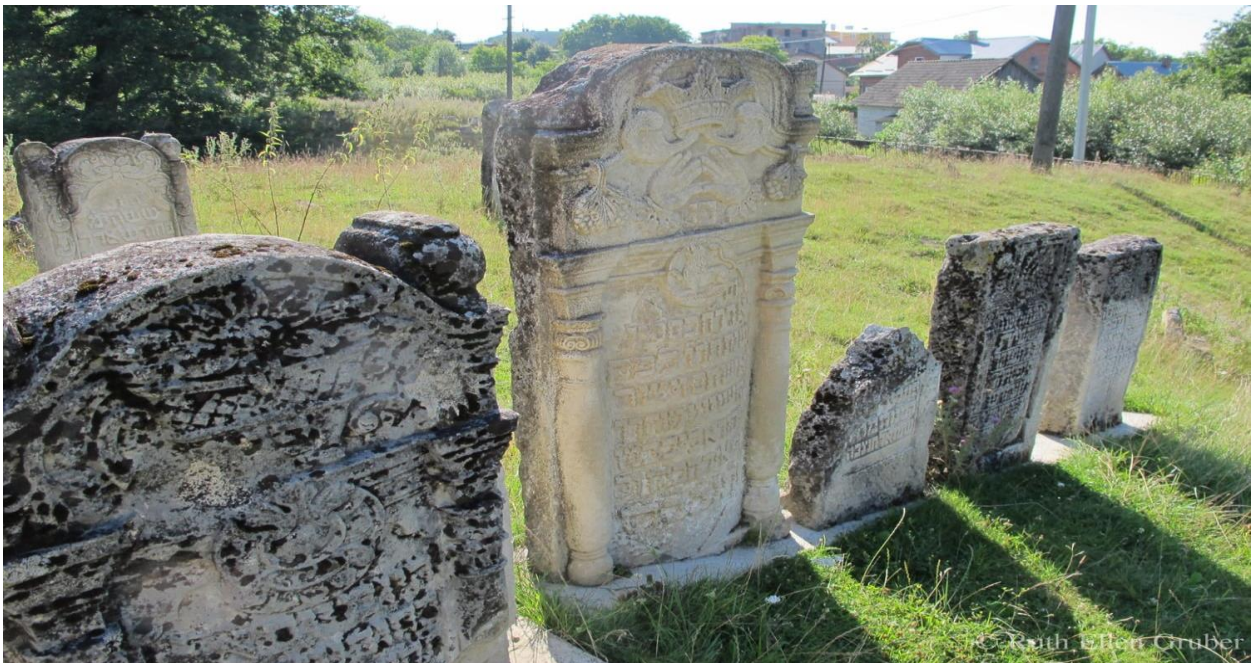
Розділ, єврейський цвинтар. 2017 р. 40

Згідно зі звітом NFPJS, близько 286 мацев було встановлено на бетонних фундаментах.