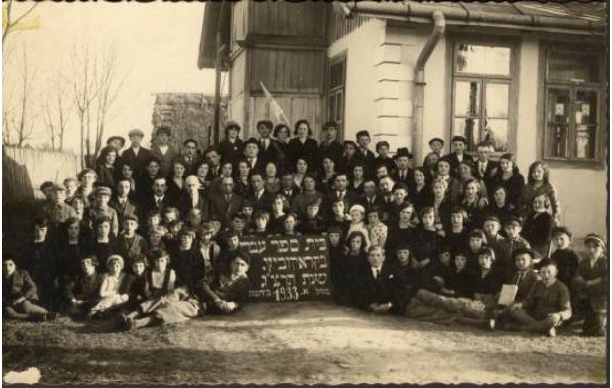
Краківецька єврейська школа, 1933 р.

окупований німецькою армією. 17 вересня, коли нацисти зміцнили свою владу на заході Польщі, Червона армія наступала зі сходу. Відповідно до таємних протоколів передвоєнної угоди, Гітлер і Сталін ліквідували незалежність Польщі і розділили країну навпіл. Краковець увійшов до складу Радянської Республіки України.