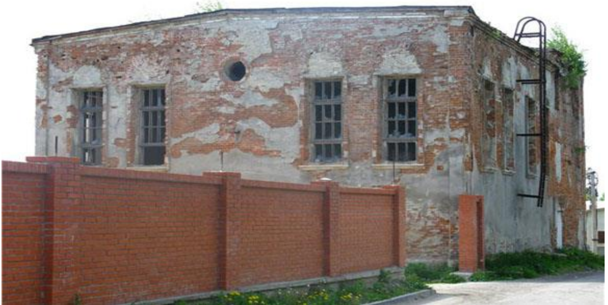
Розділ, будівля синагоги. 2011 р. 41