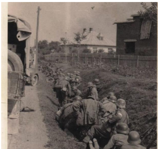
Німецькі війська в Рудках, 1939 р.

12 вересня 1939 року німецькі війська увійшли в Рудки. Незабаром після