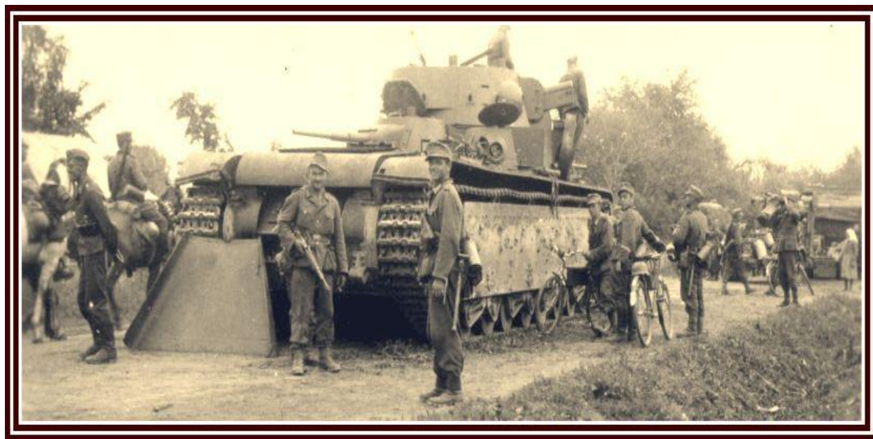
Судова Вишня в період німецької окупації 54

У 1959-2020 роках Судова Вишня входила до складу Мостиського району Львівської області спочатку УРСР, а від 1991 року – України.