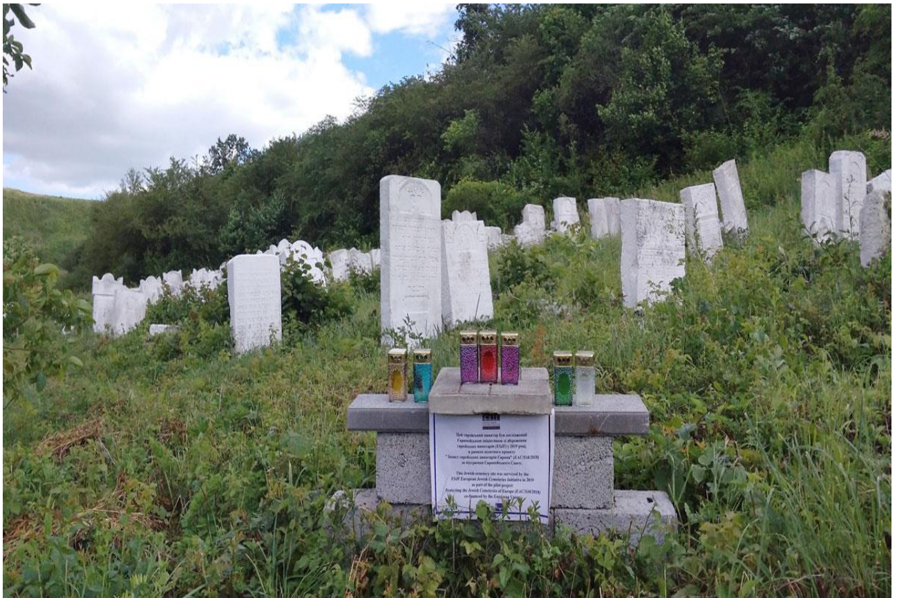
Миколаїв, єврейський цвинтар. Дата найдавнішого надгробка – 1873 р. 16

Жоден меморіал не позначає братську могилу.