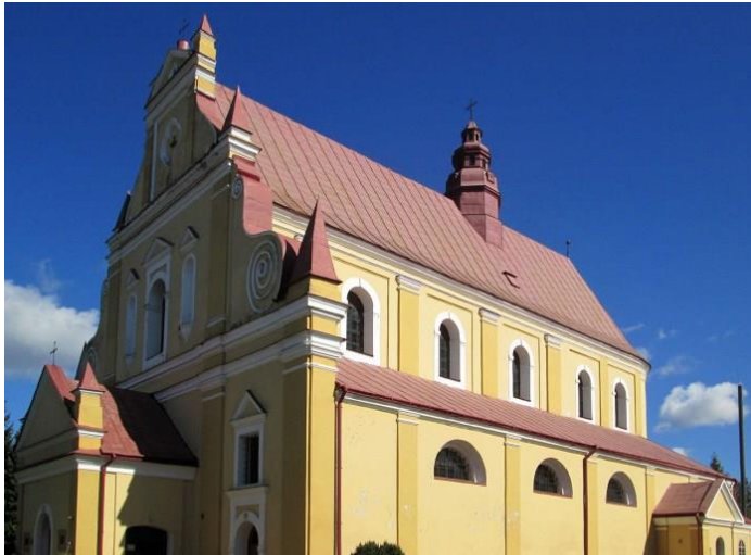
Костел Успіння Пречистої Діви Марії в Рудках.

Заслуговує уваги той факт, що у крипті костелу міститься каплиця –