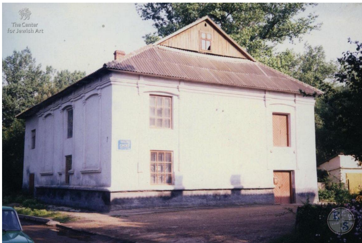
Синагога в Рудках, 1993 р. 46

9 квітня 1943 року таємна поліція і СД зі Львова за допомогою німецької жандармерії ліквідували гетто в Рудках. Близько 300 робітників було відправлено до трудового табору на вул. Янівську у Львові. Багатьом євреям вдалося втекти і сховатися у місцевих селян. Пережили Голокост лише 18 євреїв з Рудків.