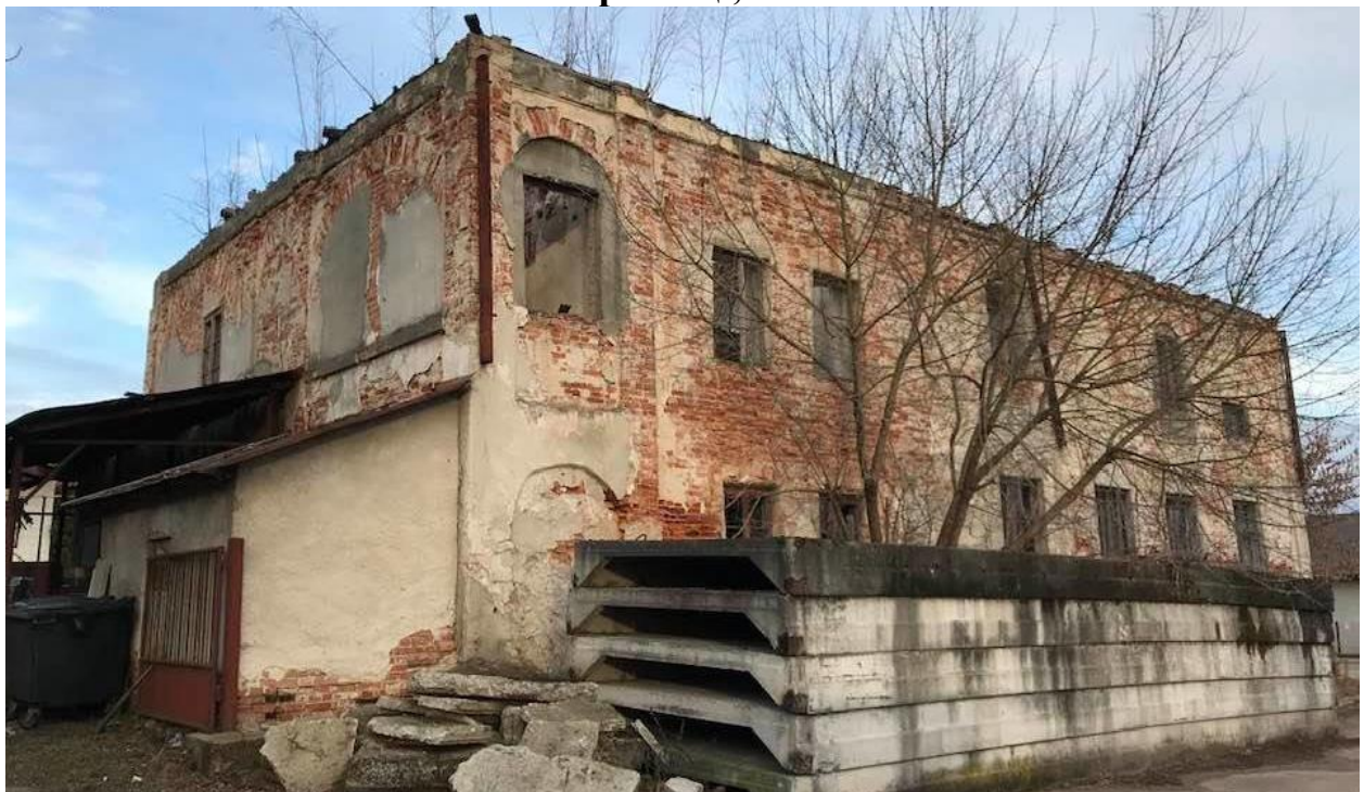
Синагога в Краківці, 1920 р. 5