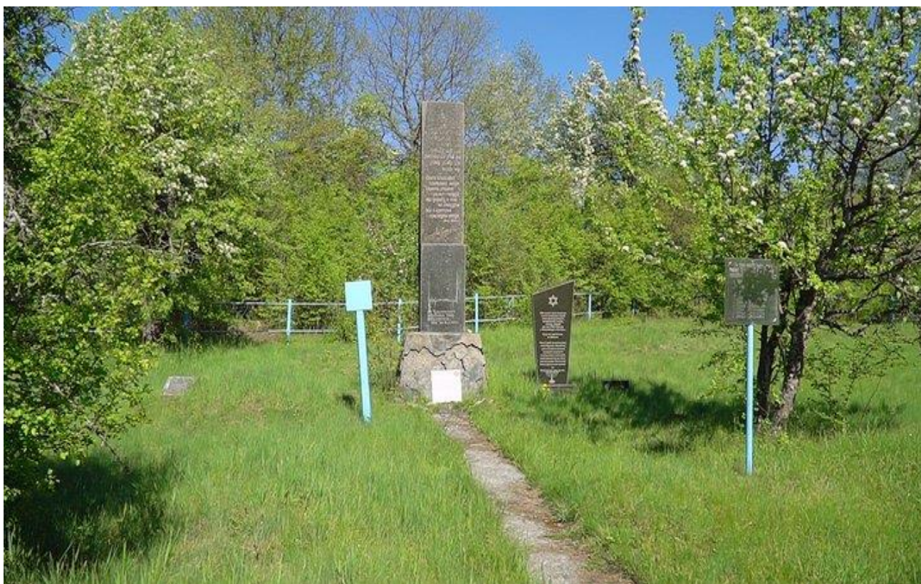
Село Печера, місце розстрілу євреїв з концтабору «Мертва петля». 6

17 березня 1944 р. залишившихся в живих нас звільнили. Я повернулася в смт. Брацлав. Батьківський будинок був зруйнований німцями. З рідні у мене нікого не залишилося. Виховувалась в дитбудинку, а по закінченню війни мене на виховання взяв дядя, брат батька.