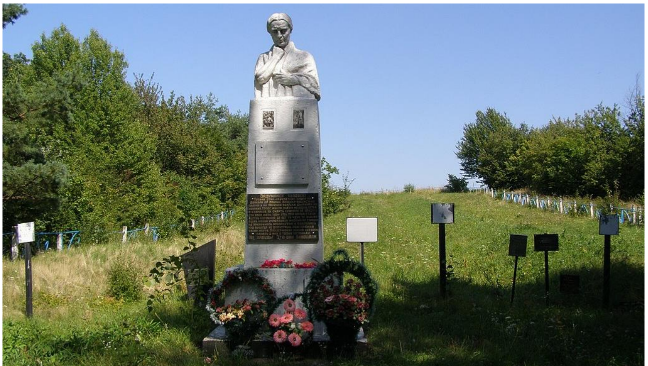
Братська могила мирних жителів, с. Печера 2014 г. 5

Нижче подаються матеріали, які зберігаються у фондах Національного історико-меморіального заповідника „Бабин Яр”. Публікуються вперше.