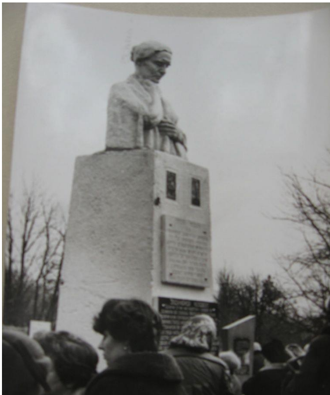
Відкриття пам'ятника жертвам концтабору «Мертва петля», 1989 р.

М. Могилів — Подільський. Сюди на початку війни німці зганяли євреїв з