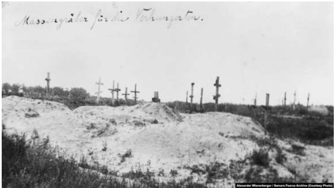
«Братські могили для голодаючих» (авторський підпис). Окраїни Харкова, 1933 год.