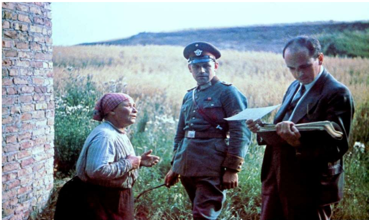
Роберт Ріттер - німецький психолог. Автор робіт, які обгрунтовували необхідність планомірного переслідування циган як «неповноцінної нації»

Пам'яті і знанню про геноцид ромів не можна дозволити втратитись або залишитися такими, як вони є зараз. Ми винні це як тим ромам, що стали жертвами геноциду, так і тим, що його пережили, їхнім нащадкам тощо. Окрім цього, засудження звірств проти ромів у минулому є нагальним для боротьби з антициганізмом, що є актуальним зараз.