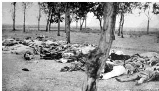
Вбиті в Османській імперії вірмени