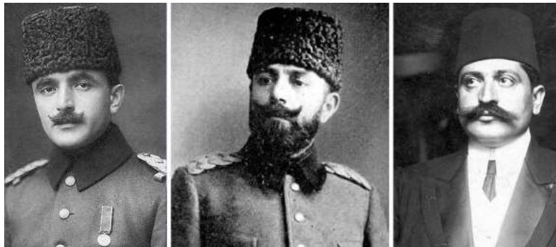
Головні організатори геноциду вірмен: військовий міністр Енвер-паша, міністр військово-морських сил Джемаль-паша, міністр внутрішніх справ Талаам-паша.

Палата представників Конгресу США у вівторок, 29 жовтня 2019 р., переважною більшістю голосів ухвалила резолюцію про визнання вбивства 1,5 мільйона вірмен в Османській імперії в 1915-1923 роках геноцидом. За це рішення проголосували 405 з 435 конгресменів, причому як демократи, так і республіканці. Проти висловилися лише 11 членів Палати представників.