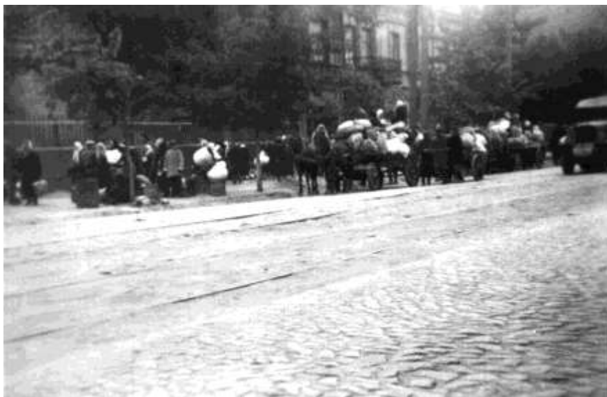
Кияни йдуть у Бабин Яр, 29 вересня 1941 р. 3

В різних публікаціях даються різні цифри загальної кількості людей, знищених у Бабиному Ярі, – приблизно від 70 тисяч до 200 тисяч чоловік. У 1946 році на Нюрнберзькому процесі наводилася оцінка близько 100 тисяч чоловік, згідно з висновками спеціальної державної комісії для розслідування нацистських злочинів під час окупації Києва. Більшість тіл було спалено за наказом Німецького командування у 1943 році.