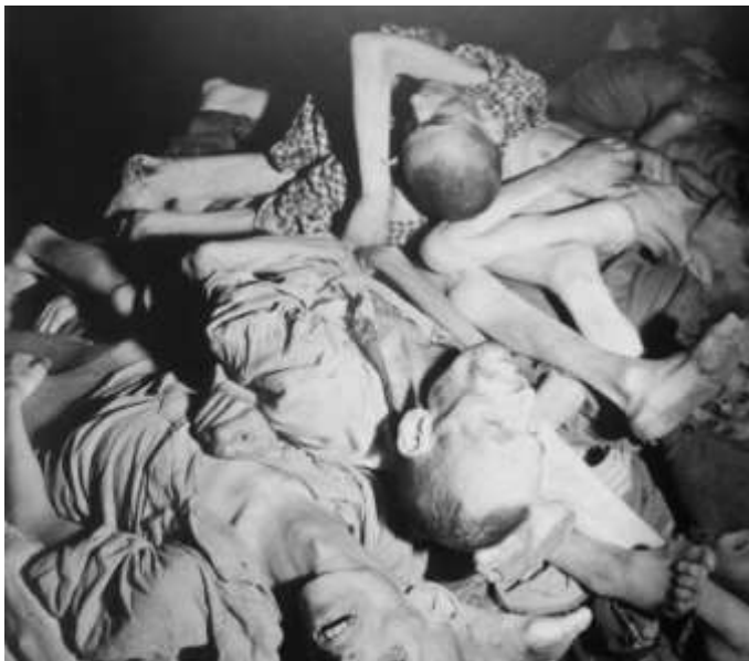
Тіла загиблих в'язнів концтабору Бухенвальд. Автор: Лі Міллер (Lee Miller), 1945 р.

До 1940 року планувалося вирішити єврейське питання шляхом масового виселення з Німеччини та інших, зайнятих нею, регіонів. Другим етапом був початок концентрації всіх євреїв у гетто, які відкривалися в Польщі та інших східних областях, окупованих Німеччиною. Це тривало до 1942 року. Третій етап передбачав остаточне рішення єврейського питання, суть якого полягала саме в планомірному фізичному знищенні народу. Були вбиті люди, місцева культура євреїв, знищена пам'ять про цю унікальну невід'ємну частину культури Східної Європи.