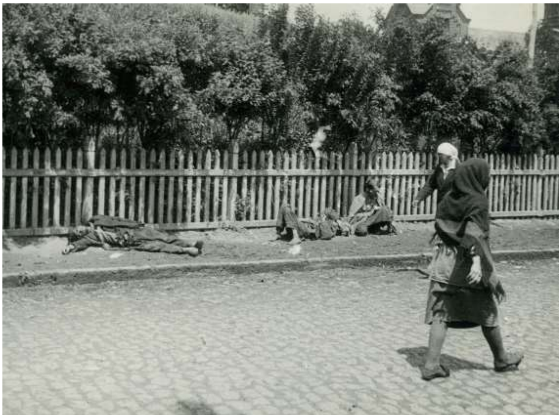
Жертви голоду. Харків, 1933 р.